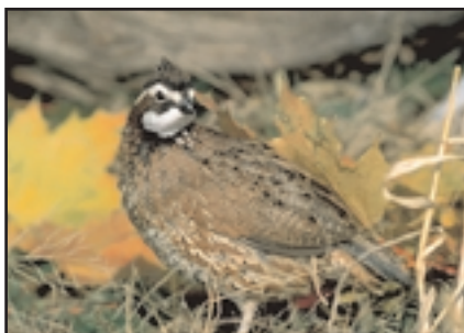
Las codornices necesitan vegetación inferior a las 6 pulgadas de altura para usarse como percheros.