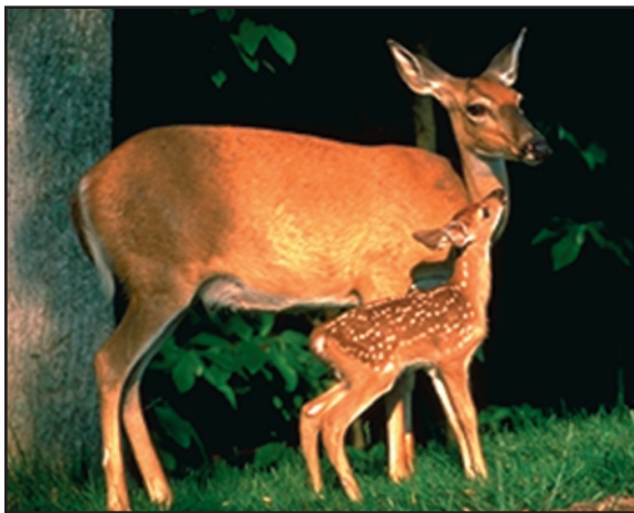
Cobertura para esconderse es especialmente importante durante la temporada de pariciones.

La dieta del venado cola blanca es diversa y cambia con la temporada (gráfica 1). Prefieren herbáceas y frutos silvestres, los cuales son muy estacionales y pueden variar de año en