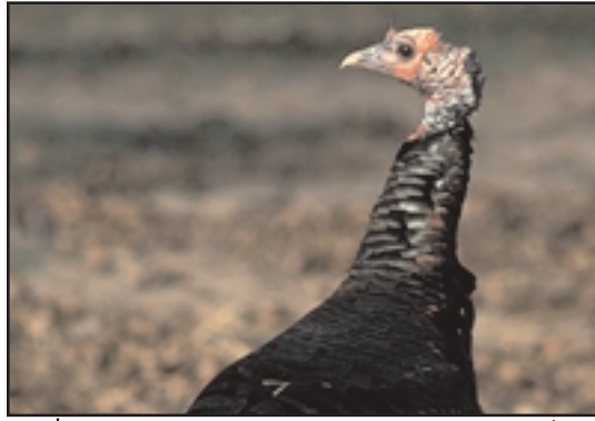
La distribución de guajolotes en Texas está controlada principalmente por la precipitación.

El manejo para el venado, codorniz y guajolotes requiere de una planeación cuidadosa. Para tener éxito, este manejo debe reunir el mínimo de necesidades de cada especie.