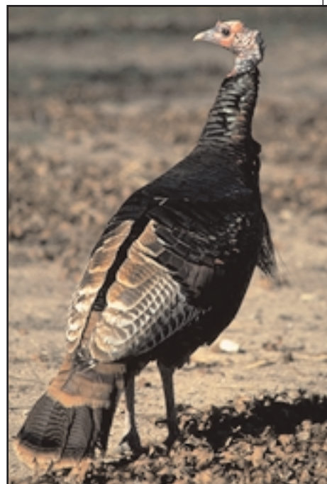
Los guajolotes prefieren anidar en pastizales en buena condición.