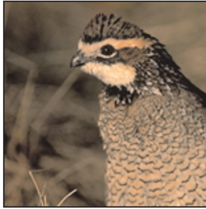
Para la codorniz, el hábitat debe aportar muchas semillas e insectos.

Los polluelos necesitan una cobertura que les brinde libertad de movimiento y les sirva de escondite. Plantas ideales para esta cobertura, son especies herbáceas de un solo tallo y con hojas abundantes en la parte superior, que además sean buen sitio para el desarrollo de insectos, los cuales son parte importante en la dieta de los polluelos. La cobertura para los