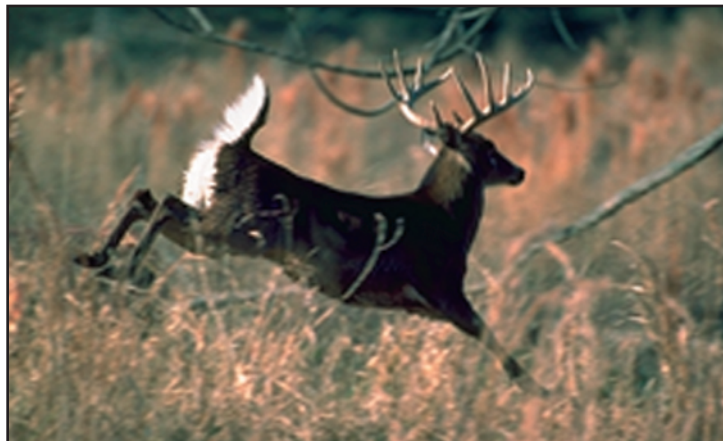
El tamaño del territorio para el venado cola blanca puede ser de 60 a 800 acres o más.